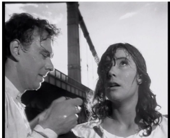
... nach einer unfreiwilligen Dusche

Mit der Idylle ist es schnell vorbei: Nazi-Deutschland marschiert in der Sowjetunion ein. Boris und sein Freund und Arbeitskollege Stepan melden sich freiwillig zur Front, zunächst ohne Wissen von Veronika und Boris' Familie. Boris' Cousin Mark dagegen, ein junger Pianist, hofft auf seine Freistellung. Mark, der in der Wohnung der Borosdins lebt, macht auch Veronika schöne Augen, ohne eine Chance bei ihr zu haben. (In der deutschen Verleihfassung des Films wurde aus Mark aus unerfindlichen Gründen Boris' Bruder, was aber in mehrfacher Hinsicht keinen Sinn ergibt. Er ist definitiv sein Cousin.)