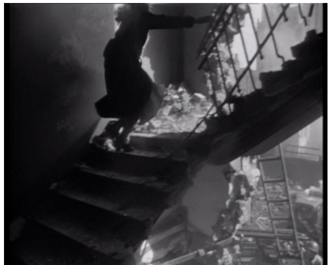
... Treppenhaus nach oben ...