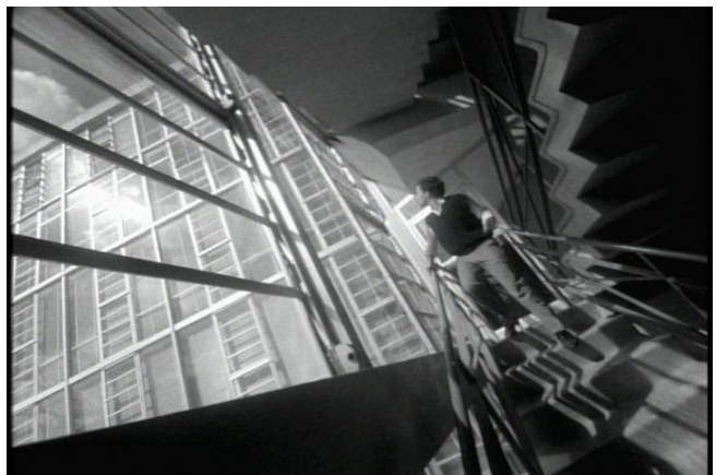
... Handlung einbezogen (Szenen aus Soy Cuba)

Wohl wegen seiner sozialistischen und antiamerikanischen Tendenz war Soy Cuba im Westen lange Zeit selten zu sehen, in vielen Ländern überhaupt nicht. Aber in den letzten Jahren erlebte Soy Cuba ein erstaunliches Revival. Aus irgendwelchen Gründen stießen Martin Scorsese und Francis Ford Coppola auf den Film und brachten ihn in einer gemeinsamen PR-Aktion dem amerikanischen Publikum nahe. Die amerikanischen Kritiker überschlugen sich teilweise vor Begeisterung, und heute ist Soy Cuba ebenso wie Letjat schurawli auf DVD erhältlich.