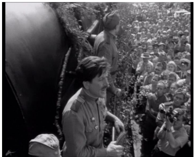
... und hält eine Rede

Der aufgebrachte Fjodor stellt Mark zur Rede und hält ihm eine Strafpredigt, dann verbannt er ihn aus dem Kreis der Familie. Dagegen hält er Veronika, der er längst verziehen hat, zurück, als diese ebenfalls gehen will. Etwas später taucht ein Kamerad von Boris in der Unterkunft der Borosdins auf und überbringt die Todesnachricht. Er erzählt, dass Boris auch während der heftigsten Kämpfe immer von seiner Belka gesprochen hat. Allerdings hat er selbst Boris nicht tot, sondern nur verwundet gesehen, und so klammert sich Veronika an die Hoffnung, dass er vielleicht doch noch lebt.