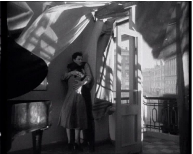
... und profitiert dabei von einem Bombenangriff

Szenenwechsel an die Front. Boris ist mit seiner Kampfgruppe in einer absolut trostlosen, sumpfigen Gegend von den Deutschen eingekesselt worden. Auf einem Erkundungsgang wird er von einer Kugel getroffen, wohl von einem Scharfschützen abgefeuert. Er bricht zusammen und stirbt kurz darauf.