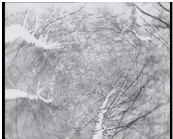
... und sich zu drehen beginnen

Am Tag von Boris' Abfahrt setzt Veronika alles daran, ihn noch einmal zu sehen, um sich zu verabschieden. Sie fährt zunächst mit einem Bus in die Nähe der Wohnung der Borosdins, steigt aus, rennt durch eine Menschenmenge und dann über eine Straße, über die gerade ein Panzerkonvoi rollt. Dabei folgt ihr die Kamera ohne Schnitt aus dem Bus heraus, durch die Menge - schnell, aber ohne störende Wackler, und immer auf Tuchfühlung mit ihr -, um in dem Moment, als sie die Straße mit den Panzern überquert, unversehens in einige Meter Höhe emporzusteigen und Veronika und die Panzer aus der Vogelperspektive zu zeigen. Nachdem Veronika Boris in der Wohnung verfehlt hat, eilt sie zum Abmarschplatz der Soldaten, wo im allgemeinen Trubel die Szene eine noch dynamischere Fortsetzung findet.