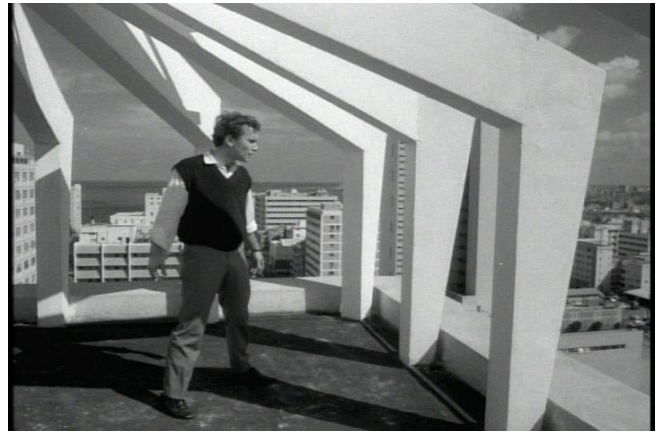
Moderne Hochhausarchitektur wird in die ...