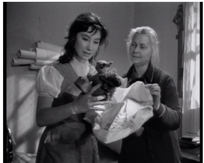
Veronika, die Großmutter, und das Eichhörnchen

Bei einem neuerlichen Luftangriff bleiben Mark und Veronika allein in der Wohnung zurück. Mark nützt die Situation, um sich wieder an Veronika heranzumachen. Zunächst ohrfeigt sie ihn, aber dann gibt sie im emotionalen und realen Chaos des Bombenhagels nach. (Einige Kritiker wollen aus der Szene herauslesen, dass Veronika von Mark vergewaltigt wird, aber dafür kann ich keine deutlichen Anzeichen erkennen.) Am nächsten Morgen eröffnen Mark und Veronika der völlig überraschten Familie, dass sie heiraten werden. Dies empfinden die Anderen als Verrat an Boris und quittieren es mit versteinerten Mienen und eisigem Schweigen.