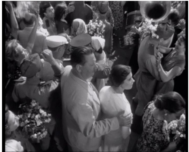
Schlusszene: Veronika hat ihren Frieden mit der Vergangenheit gemacht

“[...] aber wir werden die Gefallenen nie vergessen. Die Zeit wird vergehen. Alles wird neu aufgebaut. Unsere Wunden werden geheilt. Aber der Hass gegen den Krieg wird ewig glühen! Wir empfinden tiefes Beileid für diejenigen, die ihre Angehörigen nie mehr treffen werden. Und wir werden alles tun, damit die Bräute ihre Bräutigame nie verlieren, damit die Mütter um das Leben ihrer Kinder nie zittern, damit die mutigen Väter nie heimlich weinen müssen. Wir haben gesiegt, nicht um alles zu zerstören, sondern um aufzubauen!”