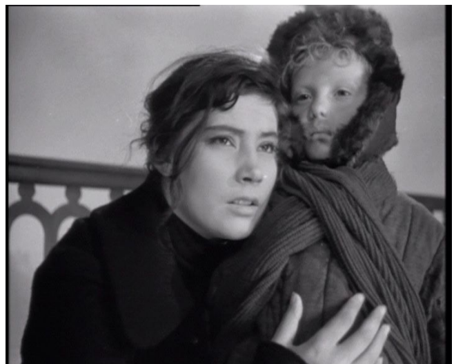
Der kleine Boris

Unterdessen hat Mark Veronikas Eichhörnchen seiner neuen Flamme Antonina geschenkt. Veronika verursacht einen kleinen Eklat, als sie sich das Eichhörnchen zurückholt und Mark dabei wild ohrfeigt. Zwischen den beiden ist es nun endgültig aus. Bei dieser Gelegenheit kommt auch endlich der im Eichhörnchen versteckte Brief zum Vorschein - Boris' letzter Gruß an seine Belka.