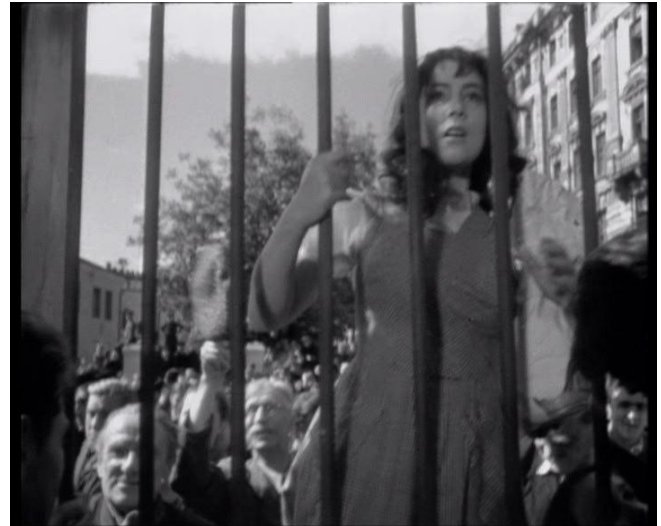
... aber sie kommt zu spät

Etwas später. Veronika und die Borosdins warten ungeduldig auf Nachrichten von Boris. Bei einem Luftangriff sucht Veronika in der U-Bahn Schutz, während ihre Eltern leichtsinnigerweise in der Wohnung zurückbleiben. Das Wohnhaus erhält einen Volltreffer - Veronikas Eltern sind tot. Die verstörte Veronika wird von den Borosdins in ihrer Wohnung aufgenommen, als sei sie bereits Boris' Frau.