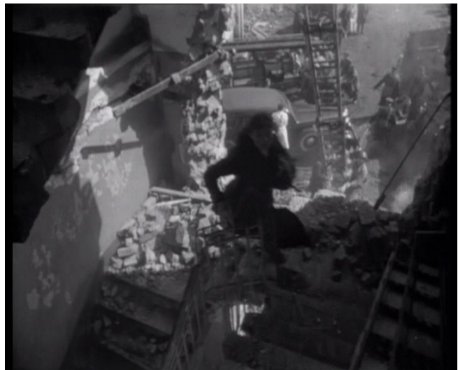
Veronika hastet im zerbombten ...

Kalatosow und Sergej Urussewski hatten 1955 erstmals zusammengearbeitet, Letjat schurawli war der zweite von insgesamt vier gemeinsamen Filmen. Die beiden hatten eine ungeschriebene Übereinkunft, die ihnen ein gegenseitiges Vetorecht einräumte: Keiner der beiden würde in seinem Bereich etwas durchsetzen, was dem anderen nicht gefiel. Aber die beiden lagen in künstlerischer Hinsicht ohnehin auf einer Wellenlänge, wie Batalow im erwähnten Statement erzählt. Er bezeichnet es als einen Glücksfall, dass sich die beiden gefunden hatten.