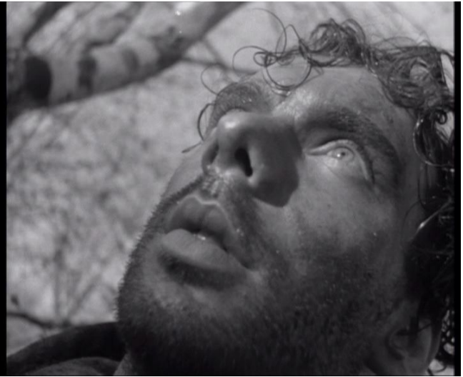
... und wird kurz darauf tödlich getroffen

Im Lazarett kommt es zu einem kleinen Tumult. Ein verwundeter Soldat randaliert, als er erfährt, dass seine Braut in seiner Abwesenheit einen Anderen geheiratet hat. Fjodor Iwanowitsch hält dem Mann eine Standpauke, und ohne dabei Veronikas Anwesenheit zu bemerken, erklärt er ihm, dass er an dieser "Verräterin" nicht viel verloren hat, um ihn damit wieder aufzurichten. Aber Veronika bezieht die Predigt auf ihre eigene Situation, und ihre Selbstvorwürfe schlagen in jähe Verzweiflung um. Sie rennt fluchtartig ins Freie und auf eine Brücke, um sich vor einen heranbrausenden Zug zu stürzen. Im letzten Augenblick kommt es anders: Ein kleiner elternloser Junge wird auf der Straße neben Veronika beinahe von einem Auto überfahren. Ihre Selbstmordgedanken sind jetzt verfliegen, sie kümmert sich um den Jungen - der auch Boris heißt - und nimmt ihn mit in ihre Unterkunft.