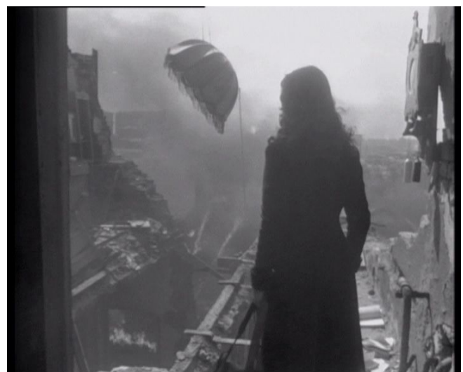
... doch die Wohnung ist komplett zerstört