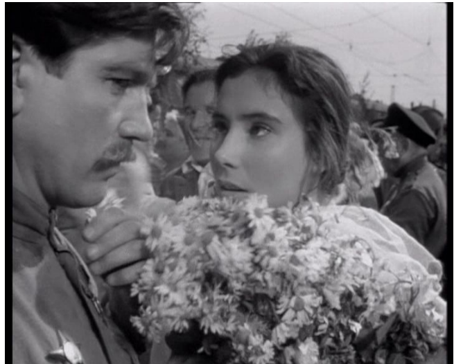
Stepan überbringt die endgültige Todesbotschaft

Währenddessen macht Antonina ihrem anderen Verehrer Tschernow Aussichten, falls dieser ihr eine Spazierfahrt spendiert. Da er keinen Wagen zur Verfügung hat, wendet er sich an Fjodor, um sich vom Lazarett einen Krankenwagen zu leihen. Er lässt durchblicken, dass er das als Gegenleistung für seine erwiesenen Gefälligkeiten erwartet. Da Fjodor keine Ahnung hat, wovon die Rede ist, erklärt ihm Tschernow, dass er doch um Marks Freistellung von der Front gebeten habe. Schnell erkennen beide, dass sich Mark mit dieser Lüge seine Freistellung erschlichen hat.