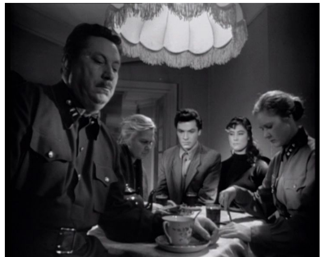
Betretenes Schweigen nach einer überraschenden Hochzeitsankündigung

Nächster Szenenwechsel: Eine Stadt irgendwo in Sibirien, in die ein Teil der Bevölkerung evakuiert wurde. Fjodor Iwanowitsch leitet das Lazarett, in dem Irina als Ärztin und Veronika als Krankenschwester arbeiten. Noch immer haben sie keine Nachricht von Boris, sie wissen nur, dass er vermisst wird. Die Ehe von Mark und Veronika, die von Anfang an unter keinem guten Stern stand, ist so gut wie gescheitert. Veronika ist deprimiert, sie macht sich Selbstvorwürfe und sehnt sich nach Boris. Dem vom aktiven Dienst freigestellten Mark gegenüber ist sie abweisend. Der wiederum beginnt ein Verhältnis mit einer gewissen Antonina Monastyrskaja, hinter der auch sein Vorgesetzter Tschernow her ist.