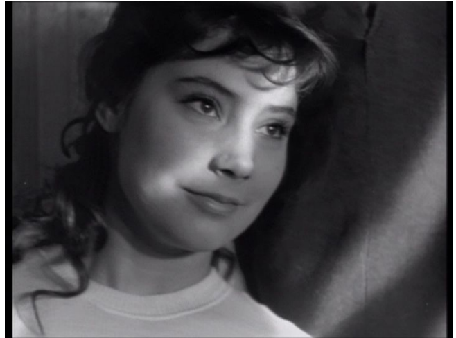
... und Veronika ...

Mit der Idylle ist es schnell vorbei: Nazi-Deutschland marschiert in der Sowjetunion ein. Boris und sein Freund und Arbeitskollege Stepan melden sich freiwillig zur Front, zunächst ohne Wissen von Veronika und Boris' Familie. Boris' Cousin Mark dagegen, ein junger Pianist, hofft auf seine Freistellung. Mark, der in der Wohnung der Borosdins lebt, macht auch Veronika schöne Augen, ohne eine Chance bei ihr zu haben. (In der deutschen Verleihfassung des Films wurde aus Mark aus unerfindlichen Gründen Boris' Bruder, was aber in mehrfacher Hinsicht keinen Sinn ergibt. Er ist definitiv sein Cousin.)