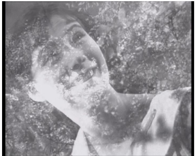
... die mit den Bäumen über ihm verschmelzen ...

Am Tag von Boris' Abfahrt setzt Veronika alles daran, ihn noch einmal zu sehen, um sich zu verabschieden. Sie fährt zunächst mit einem Bus in die Nähe der Wohnung der Borosdins, steigt aus, rennt durch eine Menschenmenge und dann über eine Straße, über die gerade ein Panzerkonvoi rollt. Dabei folgt ihr die Kamera ohne Schnitt aus dem Bus heraus, durch die Menge - schnell, aber ohne störende Wackler, und immer auf Tuchfühlung mit ihr -, um in dem Moment, als sie die Straße mit den Panzern überquert, unversehens in einige Meter Höhe emporzusteigen und Veronika und die Panzer aus der Vogelperspektive zu zeigen. Nachdem Veronika Boris in der Wohnung verfehlt hat, eilt sie zum Abmarschplatz der Soldaten, wo im allgemeinen Trubel die Szene eine noch dynamischere Fortsetzung findet.