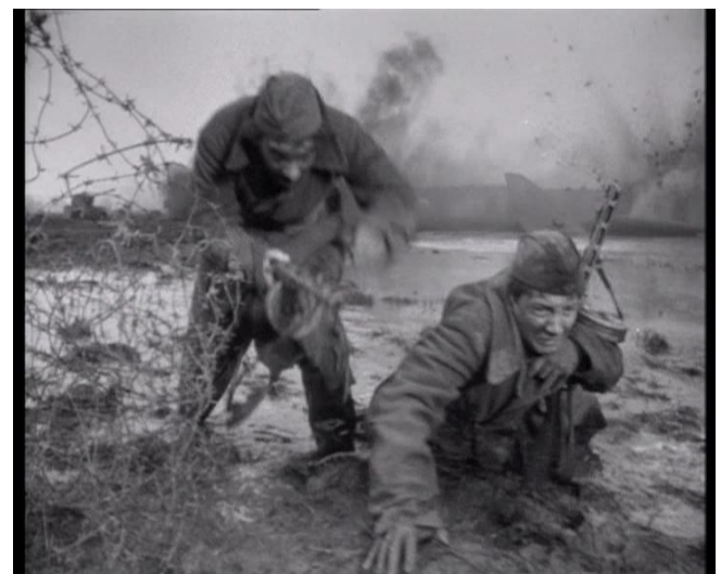
Einsatz im Schlamm